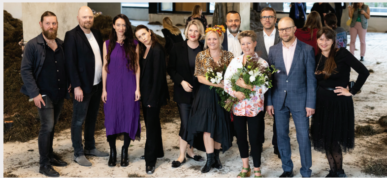
Laikmetīgās mākslas izstādes "MŪSU MĀJAS BIJA ZEME. UZPLAUKUMS" komanda.

Savā daiļradē mākslinieks pastāvīgi atgriežas pie mūsdienu mainīgās tehnoloģiskās realitātes atspoguļošanas un apjēgsmes ar kompozītķermeņu palīdzību, izaicinot iestāvējušos priekšstatus par cilvēcisko un necilvēcisko. Viņa darbu uzmanības centrā ir tā dēvētais posthumānais stāvoklis, kurā cilvēks arvien vairāk atsvešinās no paša radītajām tehnoloģijām un kur atgriešanās pie dabas kļūst jo dienas, jo grūtāka.