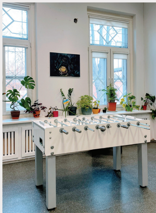
Sociālās iniciatīvas centrs "Common Ground".

pozīcijām centrā. Tā ir ne tikai lielākā izmaksu pozīcija, bet arī īpaši svarīga lieta, jo neviens centrs nevar pastāvēt bez fiziskas atrašanās vietas. Šāds atbalsts sniedz pārliecību un stabilitāti, ka centrs var turpināt darboties un pildīt savu misiju.