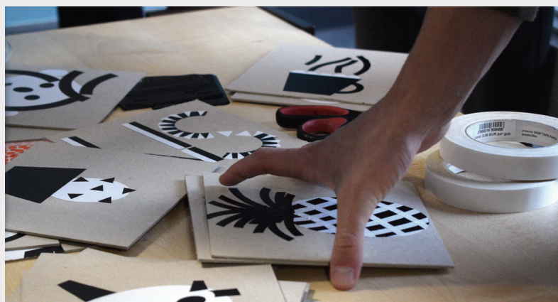
Izstādes "Māksla uz riteņiem" izglītības programma.

Mākslas centrs "NOASS" ir mākslinieku vadīta organizācija ar vairāk nekā divdesmit gadus ilgu darbības vēsturi. Biedrību 1998. gadā izveidoja mākslinieki un kultūras nozares profesionāļi, lai ar laikmetīgās mākslas un kultūras palīdzību runātu par aktuālām norisēm sabiedrībā, tās problēmām un iespējamajiem risinājumiem. "NOASS" apvieno dažādu jomu profesionāļus, rada kopprojektus, eksperimentē, meklējot jaunus radošās izteiksmes veidus, materiālus, izmantojot jaunākās pieejamās tehnoloģijas un mērķtiecīgi veidojot daudzveidīgu pasākumu programmu, lai palīdzētu ieraudzīt, sadzirdēt, sajūst un domāt.