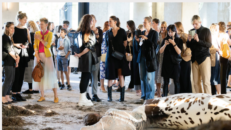
Laikmetīgās mākslas izstādes "MŪSU MĀJAS BIJA ZEME. UZPLAUKUMS" atklāšana "New Hanza" biroju ēkā Mihaila Tāla ielā 1.

Izstāde tapusi kā kolektīva prakse gan dažādu mākslas jomu saplūsmes, gan izstādes tapšanā iesaistīto cilvēku kontekstā. Izglītības un diskusiju programmas izveide kopā ar partneriem sākās jau līdz ar izstādes pirmajām idejām. Izstādes iekārtošanā tika nodrošināta prakse Latvijas Kultūras akadēmijas un