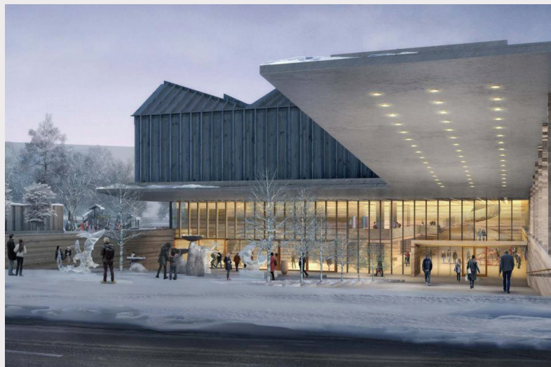
Latvijas Laikmetīgās mākslas muzeja vizualizācija.

par Latvijas Laikmetīgās mākslas muzeja būvniecības ieceres realizācijas iespējām”, kurā piedalās tai skaitā Latvijas Laikmetīgās mākslas muzeja fonds. Ir atrasts risinājums Latvijas Laikmetīgās mākslas muzeja būvniecībai – potenciāli būvēt muzeja ēku saskaņā ar privātās-publikās partnerības (PPP) projektu, Rīgas domei uzņemoties publiskā partnera lomu. Panākts, ka muzejs kā prioritāte ir iekļauts Evikas Siliņas valdības rīcības plānā, nosakot divus uzdevumus – izveidot Latvijas Laikmetīgās mākslas muzeja darbības institucionālo vienību un sākt paplašināt muzeja krājumu, kā arī uzsākt Latvijas Laikmetīgās mākslas muzeja projekta īstenošanu ar Rīgas valstspilsētas pašvaldību, kā projekta realizēšanas modeli piedāvājot PPP.